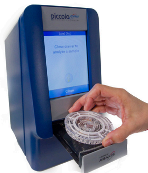
Piccolo Xpress® Analizador Bioquímico

Exámenes rutinarios bioquímicos en el punto de atención al paciente, con resultados en menos de 15 minutos.